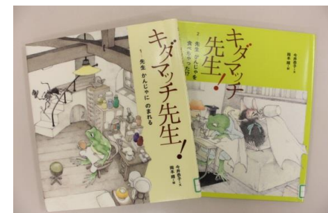
今井恭子/文 岡本順/絵 BL出版

児童室では、絵本や紙芝居のほか、読み物や調べもの本など、幅広くご用意しています。図書館で作成したブックリストの配布や、テーマ展示もしています。毎週火・土曜日にはおはなし会も行っています。おすすめの本は「キダマツ千先生！」(今井恭子/文 岡本順/絵)です。カエルのキダマツ千先生は、どんな病気や怪我も治してくれると評判の名医です。さて、今日はどんな患者さんが訪ねてくるでしょうか？